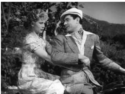
La Fille du puisatier, de Marcel Pagnol, 1940