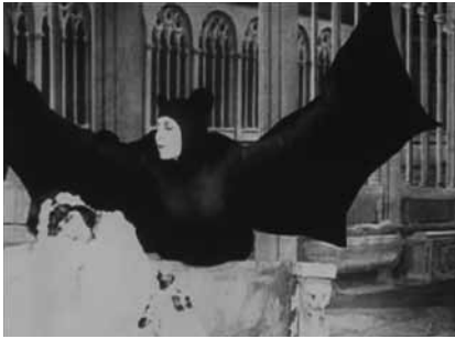
Les Vampires , de Louis Feuillade, 1915 © D.R.

À partir d'extraits des Vampires de Louis Feuillade et des Vampires de Riccardo Freda, Marina De Van prépare une intervention sur la question des effets spéciaux du point de vue de la transformation des visages féminins : fusion laideur/beauté, jeunesse/vieillesse, etc. (cf. son dernier film - Ne te retourne pas ). Rappelons que dans le film (en noir et blanc) de Freda, les transformations de la belle aristocrate en vieille femme furent réalisées au tournage, sans interruption du jeu d'acteur, par un système d'éclairages chromatiques (conçu par Mario Bava, le directeur de la photo) qui permettait, en plaçant en direct des filtres de couleur sur des projecteurs, de faire progressivement apparaître un maquillage (de vieillissement) invisible sans ces filtres.