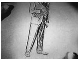
So Dark the Night, de Joseph H. Lewis, 1946