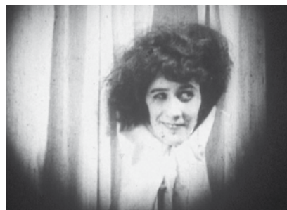
Les Mystères d'un salon de coiffure , de Bertolt Brecht, 1923

En première partie : Notre Brecht , un film sans pellicule, mais avec musique, autour de Bertolt Brecht et le cinéma français, par Pierre Léon et Benjamin Esdraffo.