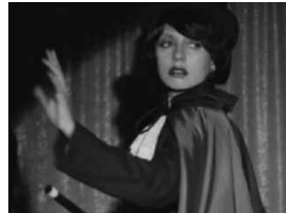
Céline et Julie vont en bateau, de Jacques Rivette, 1974