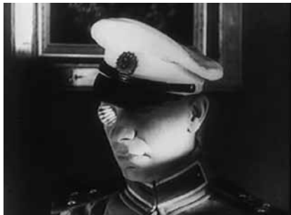
Folies de femmes , d'Erich Von Stroheim, 1922

Eric et Ramzy ont utilisé le Centre Pompidou comme décor dans Seuls Two , le premier film qu'ils ont réalisé. Ils commentent et analysent en direct des extraits de films de et avec Erich von Stroheim, avec une insistance particulière sur les chauves, les métèques, le Front Populaire et le rapport entre innocence et perversité.