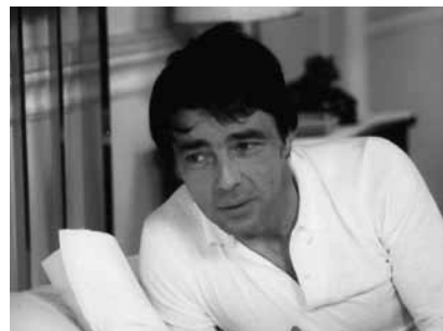
Le Pélican , de Gérard Blain, 1973

Spéctacle de Dorian Pimpernel autour du lien unissant les librairies musicales de la fin des années 1960 et certains compositeurs français de bandes originales du début des années 1970, à partir des films de Gérard Blain et du cinéma bis français.