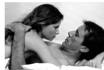
Fast Walking, de James B. Harris, 1982

Dimanche 7 novembre, 14h30, Cinéma 2 Séance présentée par Pierre Rissient FILM INÉDIT