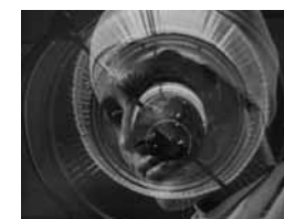
Strange Impersonation, d'Anthony Mann, 1946