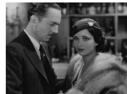
Voyage sans retour, de Tay Garnett, 1932

Samedi 6 novembre, 20h, Cinéma 2 Séance présentée par Luc Moullet