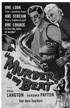
Murder is My Beat , d'Edgar G. Ulmer, 1955