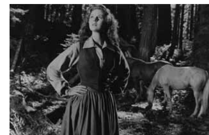
Le Passage du canyon , de Jacques Tourneur, 1946

Dimanche 14 novembre, 14h30, Cinéma 2 Séance présentée par Serge Bozon