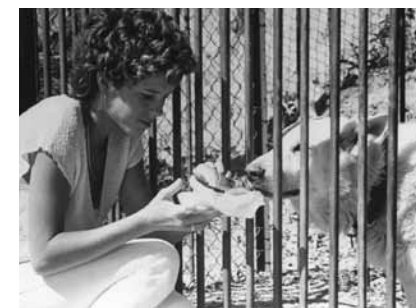
Dressé pour tuer, de Samuel Fuller, 1982

Dimanche 7 novembre, 17h, Cinéma 2 Séance présentée par Louis Skorecki