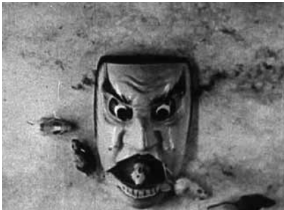
Japon de fantaisie , d'Emile Cohl, 1909

Riad Sattouf choisit des films d'Emile Cohl et en fabrique la bande-son (dialoguée). Il présente l'ensemble au public.