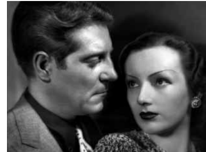
Pépé le moko, de Julien Duvivier, 1937