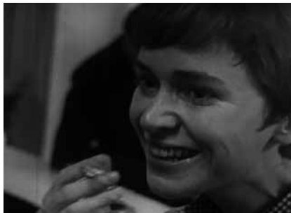
Nadja à Paris , d'Eric Rohmer, 1964

Djibril Glissant intervient, à partir de Nadja à Paris d'Eric Rohmer, sur la question du rapport entre « ligne claire » et « films à règles ». Le cinéma ne peut filmer directement ce qui agite la tête des personnages, mais juste leurs actions. Les cinéastes de la ligne claire font de cette impossibilité une vertu en accentuant cet effet de surface : refus du jeu à tourments (de type Actor's Studio) ; cadres fixes ; absence de musique d'accompagnement ; littéralité généralisée, etc. Or une des manières les plus simples d'obtenir cette accentuation est de concevoir un film uniquement à partir de règles choisies au préalable. De Rohmer à Greg Mottola, en passant par Gilles Marchand, Wes Anderson, Philippe Ramos, Emmanuel Mouret et ses propres films, Glissant propose un parcours réglé et en ligne claire intitulé : « Qui tire les fils ? ».