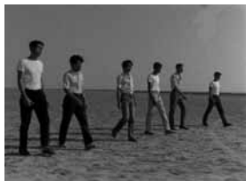
Lettre à la prison , de Marc Scialom, 1969

À partir de Lettre à la prison , son film-fantôme (tourné en 1969, sorti en 2009), Marc Scialom intervient sur ses deux influences principales (Godard et Nemeč) autour du rapport ethnographie vs fiction, film essai vs film social, surréalisme vs réalisme.