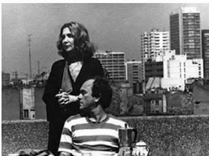
Loin de Manhattan , de Jean-Claude Biette, 1982

À partir d'un making of inédit de Jean-Christophe Bouvet sur le tournage de Loin de Manhattan et d'un de ses films inédit sur Jean-Claude Biette, Jean-Christophe Bouvet et Jean-Charles Fitoussi interviennent sur la question des pauses de tournage (attente de la lumière ou de l'inspiration, italiennes entre acteurs, etc.). Fitoussi présentera des petits films inédits sur cette question de la pause, avec Bouvet comme acteur.