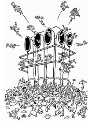
Beaubourg vu par Willem

Sur le modèle de ses Aventures de l'art (édité chez Cornélius), Willem s'inspire d'un film surprise (une comédie années 1950), c'est à dire réalise des planches inspirées par le film qui sera diffusé en direct. Plus exactement, il y aura trois écrans : un écran diffusant le film surprise, un écran diffusant les dessins de Willem, un troisième écran diffusant le film ainsi redessiné ou caricaturé en direct par Willem (grâce à un mélangeur).