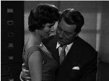
Touchez pas au Grisbi, de Jacques Becker, 1953