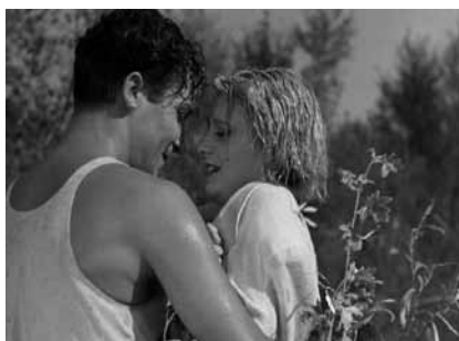
Treno popolare , de Raffaello Matarazzo, 1933

Samedi 13 novembre, 17h, Cinéma 2 Séance présentée par un invité surprise