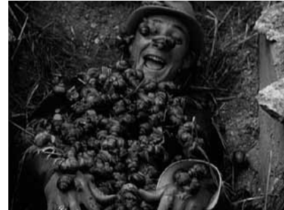
Onésime, dresseur d'hommes et de chevaux , de Jean Durand, 1913

Thomas Salvador choisit des films de Jean Durand et fait une intervention autour de la sélection choisie, centrée sur la question du mime et du burlesque, sous la forme d'une alternance de projections de courts métrages (de Jean Durand) et d'intermèdes (de lui-même) : petits films inédits inspirés par Durand et cascades solitaires en direct.